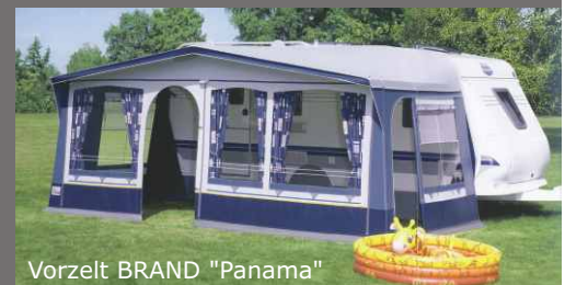
Vorzelt BRAND "Panama"